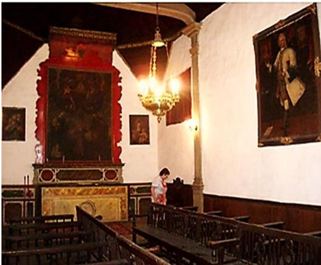
INTERIOR DE LA CAPILLA DE LA SANTÍSIMA TRINIDAD

El pequeño templo forma unidad arquitectónica y visual con la fachada de la Casa Peraza de Ayala y mantiene los patrones de capillas y ermitas dispersadas por el municipio y, en particular, en el casco histórico.